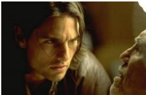
Gros plan dans Magnolia de P.T. Anderson