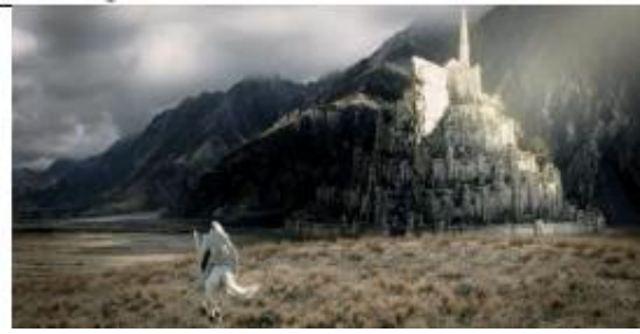
Le seigneur des anneaux - Le retour du roi de Peter Jackson